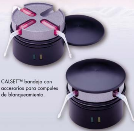
CALSET™ bandeja con accesorios para compules de blanqueamiento.